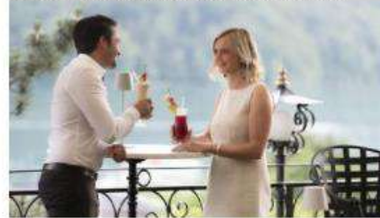
Beispiel für Ihre Bildanzeige mit 300 x 250