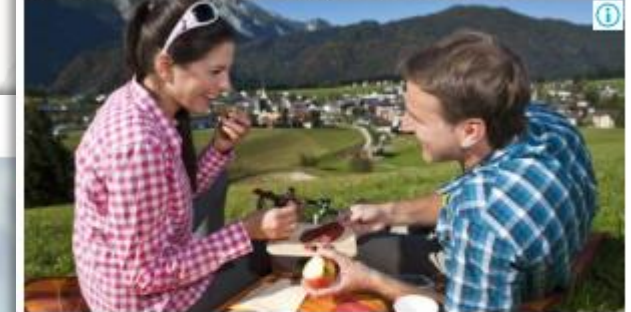
Beispiel für Ihre Bildanzeige mit 300 x 250

Gültig bis 30.11.2021 inkl. Massage, Wanderungen, Fahrradverleih + Salzkammergut-Card uvm.