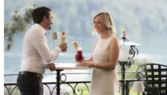
Beispiel für Ihre Bildanzeige mit 300 x 250