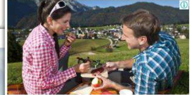
Beispiel für Ihre Bildanzeige mit 300 x 250